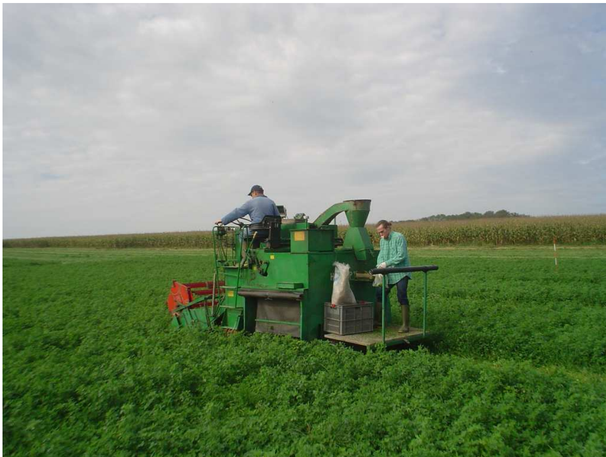
Coupe et récolte d'échantillons de fourrages à Ouffet, au moyen d'une Haldrup