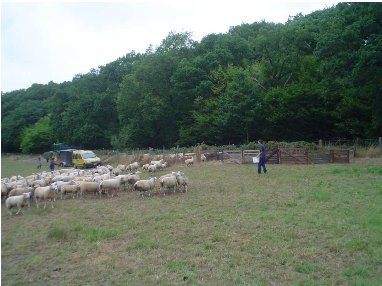
Rassemblement des agneaux dans le cadre de l'essai tannins condensés

Les recherches futures pourraient s'orienter vers l'augmentation de la fréquence des administrations de tannins condensés et l'emploi d'un fourrage naturellement riche en ces tannins.