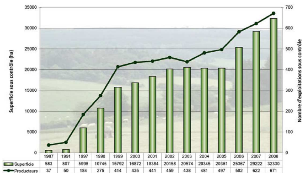
Evolution de l'agriculture biologique en Région wallonne

Au niveau du secteur de la transformation, le nombre de transformateurs augmente aussi mais de manière plus timide. Le nombre de transformateurs est passé de 257 (2007) à 266 en 2008 soit augmentation de 3,5% 1 .