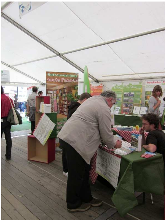
Nature & Progrès