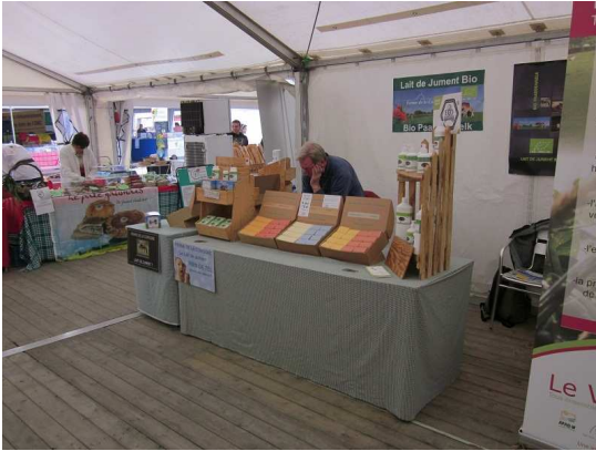
Ferme de la Comogne