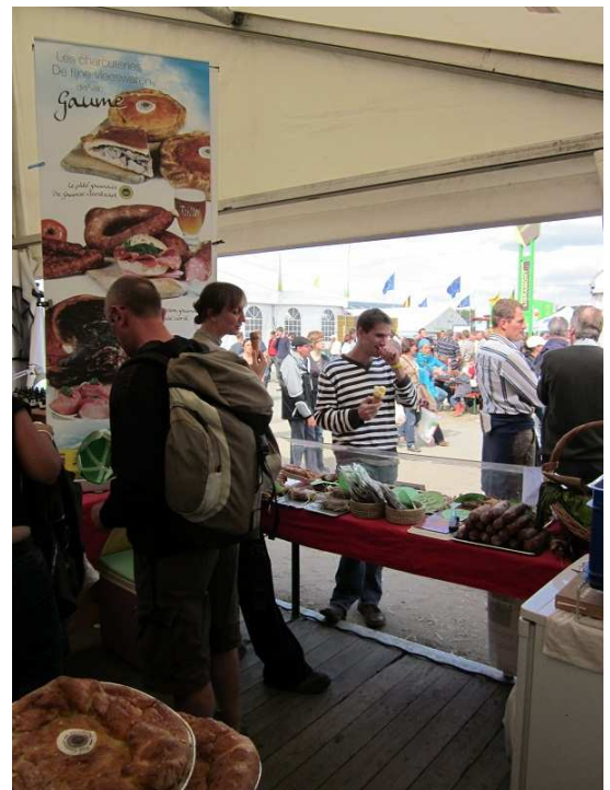
Le Caprice sur l'Assiette, l'Asinerie de l'O