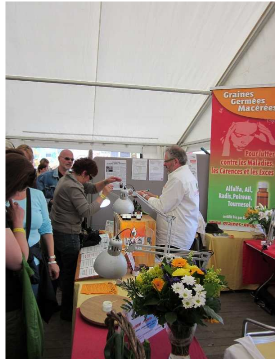
Les Graines Germées