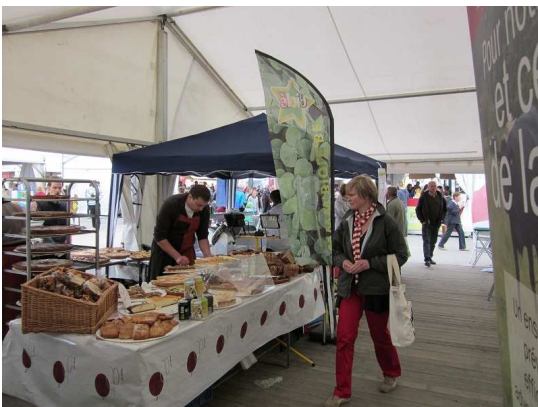
Pains se sent rire