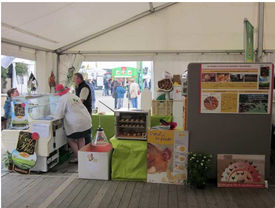
Coq des Prés