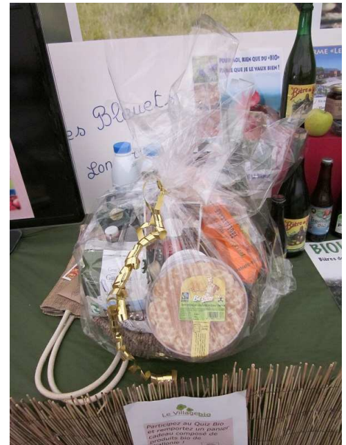
Panier pour le quizz