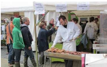
Petite restauration bio