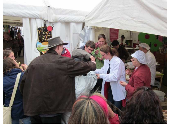
Animation traiteur+ dégustation